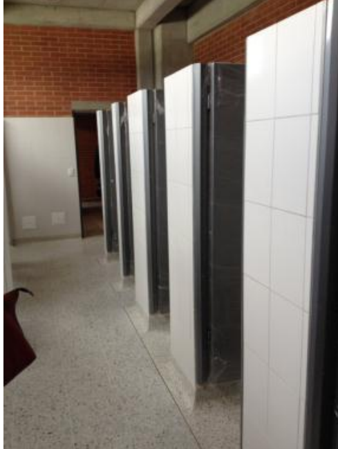
Cubierta y zona de baños