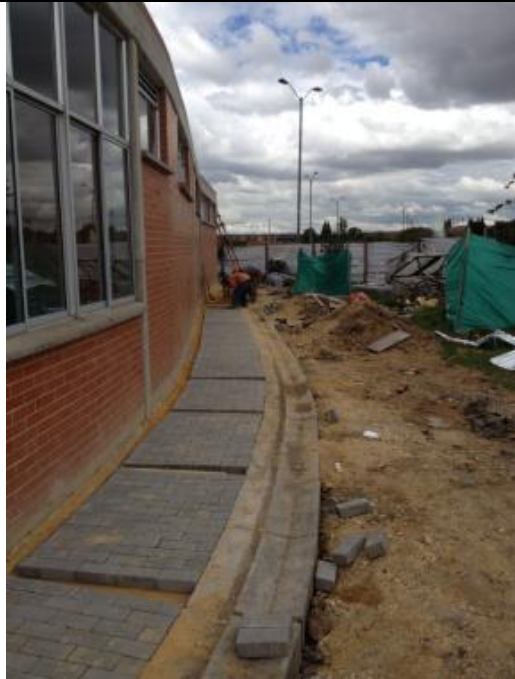
Humedad no controlada en viga canal eje F (3 -4) y Vista Exteriores